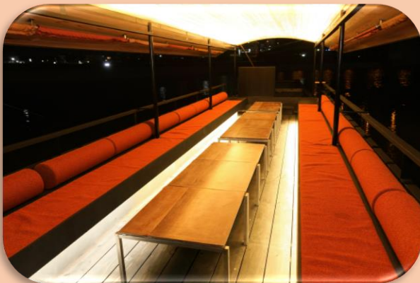
橙、緋色など篝火をイメージした華やかな内観

陽が落ち、夜の帳がおりると広がる漆黒の闇に、川面の深いブルー、金華山の深い黒、そして鶺鴒の身に着ける装束の色など落ち着いた藍の空間を演出