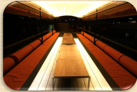
〈センターテーブルレイアウト〉 中央部に高さを抑えたテーブルを配置し、 空間をより広く演出するレイアウト