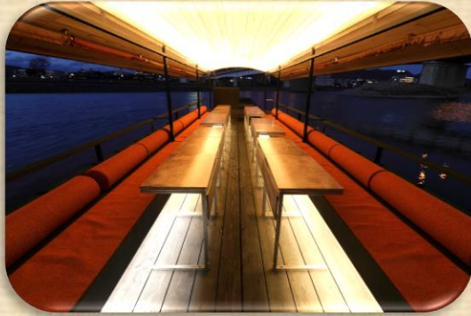
〈サイドテーブルレイアウト〉 人数分のテーブル（W65×D40×H65）を 設置した基本レイアウトで中央部に通路あり