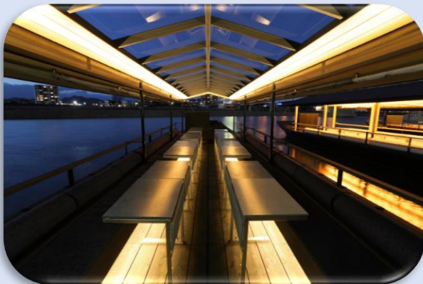
月の光も入り込むトップライトを備えた天井

白木の「白」。美濃和紙に代表される柔らかな「白」をインテリアデザインの基本に据え、屋形内側には桧や杉材を使用し、柔らかく包まれる白の空間を演出